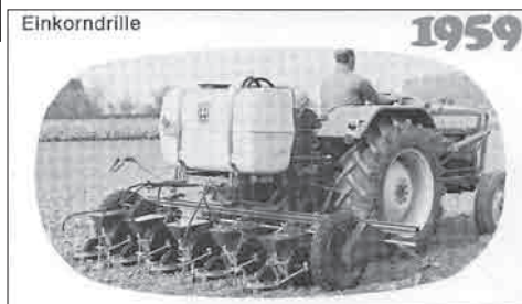
Diese Landmaschinen stellte die Salzkottener Firma Kleine u.a. von 1946 bis 1960 her.

Das Hederauenfest 2014 wirft für die Interessengemeinschaft Sälzer Treckerfreunde schon ihre Schatten voraus. Zum 10jährigen Gründungsjubiläum der Interessengemeinschaft soll eine Ausstellung aller Maschinenkomponenten der Firma Kleine in Salzkotten gezeigt werden. Vom Kleine Rübenmeister, Kleine Legemeister, Rüben- und Maisdrillen bis hin zum heutigen Rübenvollernter und