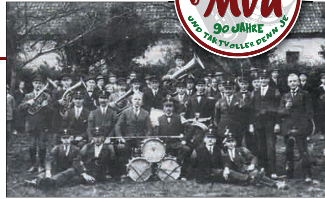
Eine historische Aufnahme des Vereins aus dem Jahr 1926.