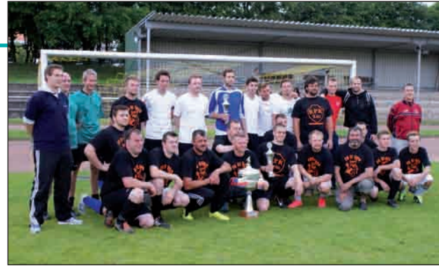
Sommerturnier 2013: Im Finale besiegte das Team FC Toro die Jungs vom Kotten. Das Bild zeigt die beiden Finalteilnehmer sowie die Vertreter der Mohnkicker.

Am 15. Juni findet auch wieder das Hobbyfuß-