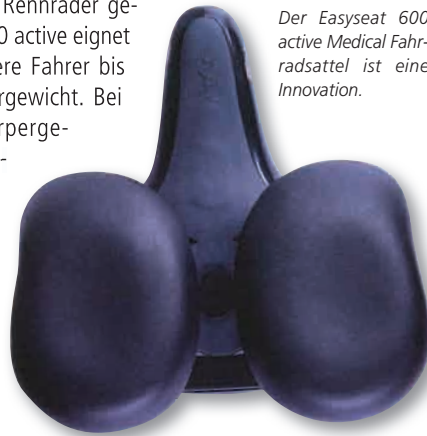
Der Easyseat 600 active Medical Fahrradsattel ist eine Innovation.

Der 600 active wird von Urologen empfohlen!