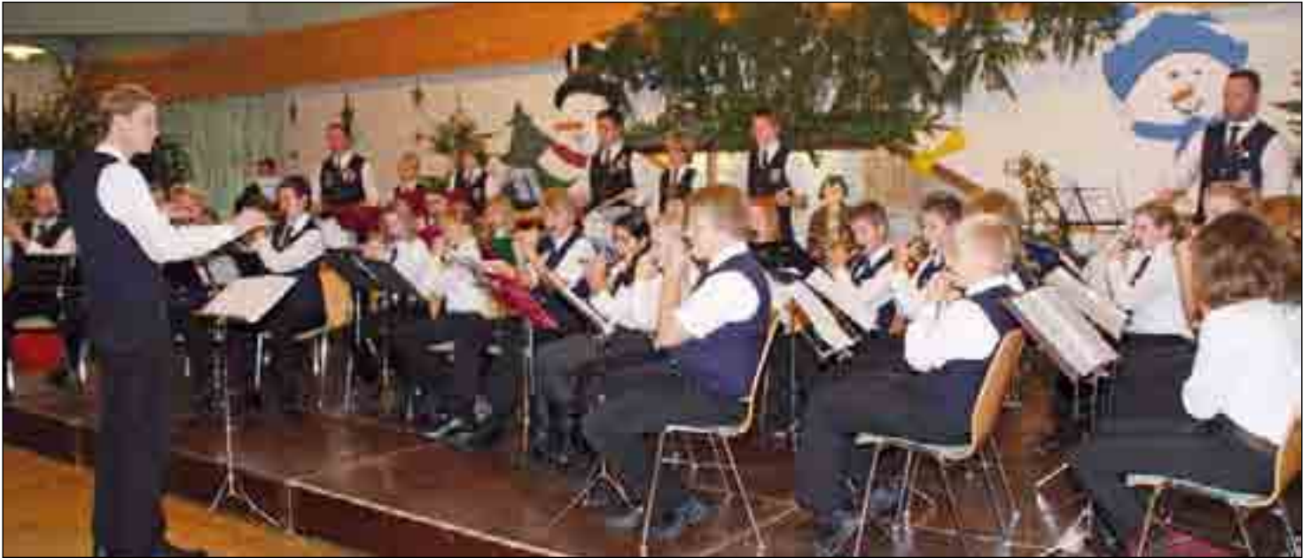
Die Jugendgruppen des Spielmannszuges Salzkotten begeisterten die vielen Zuschauer.

Über 50 Stände und viel Rahmenprogramm in der Sälzerhalle