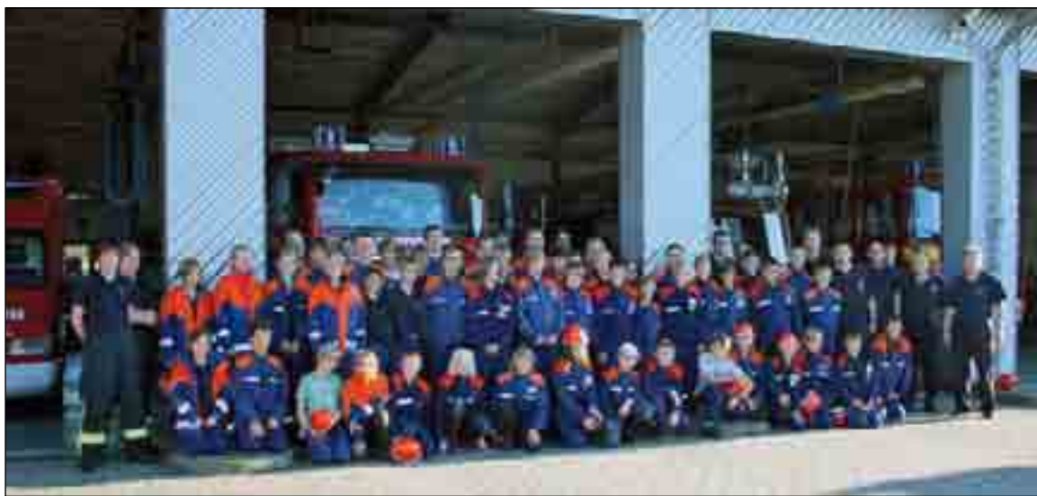
Die 50 Mädchen und Jungen der Jugendfeuerwehr Salzkotten mussten während der 24 Stunden-Aktion insgesamt 20 verschiedene Einsätze abarbeiten.

Einen ganzen Tag wie ein Berufsfeuerwehrmann erleben, das konnten kürzlich die Mitglieder der Jugendfeuerwehr der Freiwilligen Feuerwehr Salzkotten. Die „24 Stunden-Wache“ begann für die 50 Mädels und Jungs im Alter von 10 bis 18 Jahren am Freitagabend um 18:30 Uhr und endete am Samstagabend um die gleiche Zeit. Langeweile kam dabei allerdings zu keiner Zeit auf, die 10 Ausbilder und 14 Fahrer hatten sich so einiges einfallen lassen: Es musste u.a. ein brennender Strohhaufen in Thüle gelöscht, eine vermisste Person im Upsprunger Wald gesucht, ein Hub-schrauberlandeplatz am Schulzentrum Mitte ausgeleuchtet oder eine Ölkatastrophe auf dem Geseker Bach in Verlar verhindert werden. Insgesamt gab es für die jungen Retter 20 Einsätze „abzuarbeiten“, bei denen von der schnellen Lagebeurteilung und Entscheidungsfindung über den richtigen Einsatz der zur Verfügung stehenden Einsatzmittel bis zur Einsatznachbesprechung alle bislang