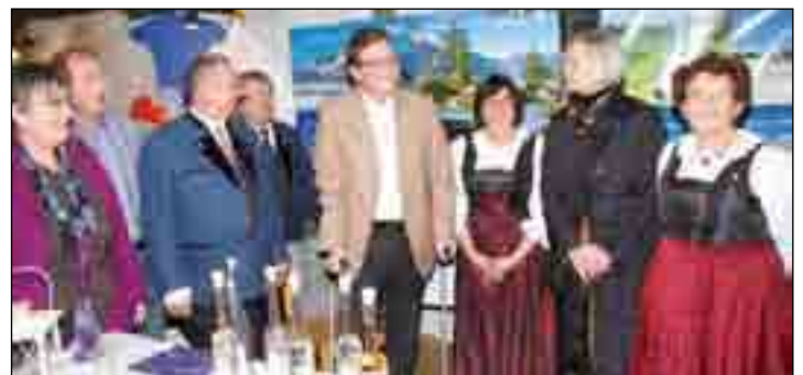
Ein großer Anziehungspunkt war der Stand der Freunde aus Seefeld.

Bastelarbeiten, Deko in Hülle und Fülle, Aquarellmalerei, Kerzenkunst und vieles mehr. Musikalisch umrahmt wurden die beiden Markttag vom Musikverein Upsprunge, dem Spielmannszug Salzkotten und dem Musikverein Verne. Die Tanzdeel zeigte eindrucksvoll, dass sie über die Kreisgrenzen hinaus ein Aushängeschild ist. Für Süßes und Deftiges sowie diverse Getränke war an den Ständen bestens gesorgt. Der große Renner war aber wie in den Vorjahren das Kaffee mit einer großen Auswahl an hausgemachten Kuchen. Resümee: Gratulation an die Schützen.